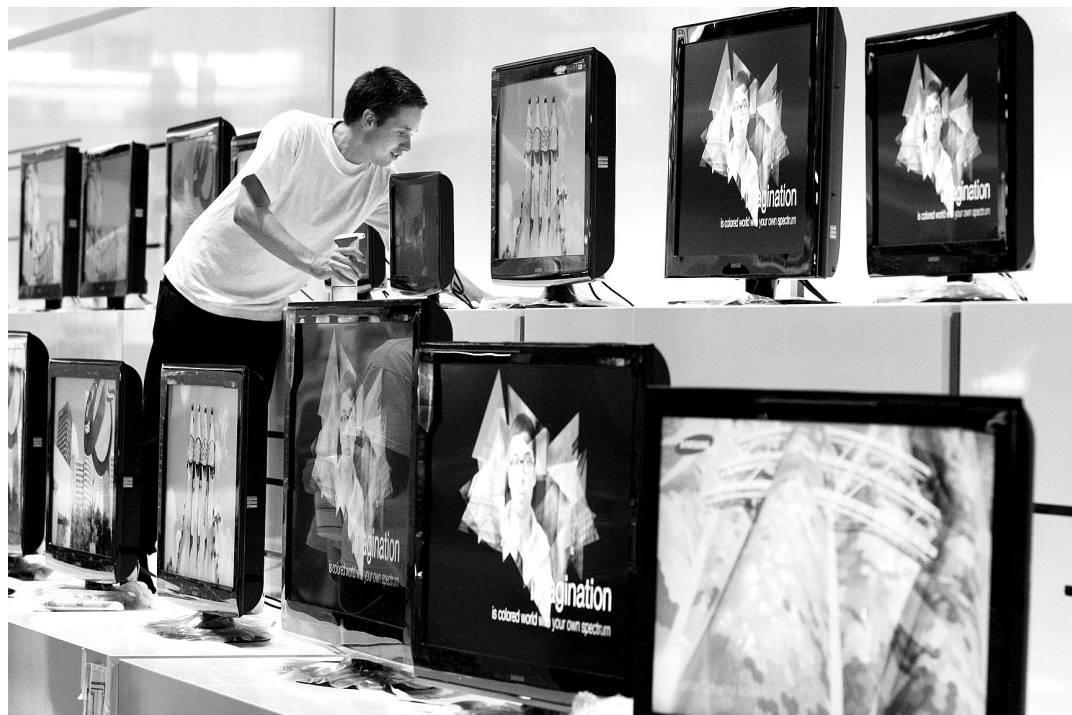
Samsung hľadá medzi slovenskými firmami nových subdodávateľov.

Zaujímavým, aj keď rizikovým regiónom môže byť pre našich podnikateľov aj Afganistan. Predstavitel miestnych odborníkov Zaher