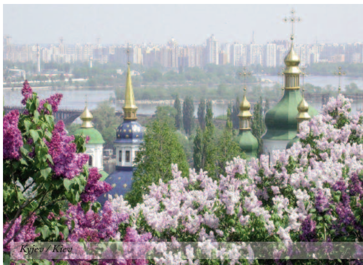
Kyjiv / Kiev

Ukrainian commercial banks may be founded by resident and non-resident legal entities or natural persons. However, legal entities which are part of another bank, citizens' unions, religious organizations or charitable foundations may not found a bank. In addition, founders of Ukrainian banks must answer to given standards pertaining to their incontrovertible